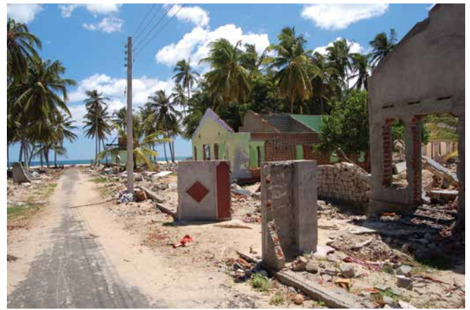
Cunami postījumi Šrilankas piekrastē (Thirukkovil, 2005. g.) Daudzviet Šrilankas austrumu piekraste izskatījās gluži kā cunami dienā. Līdzekļu trūkuma dēļ ēku gruveši nebija novākti. Cunami cietušajiem cilvēkiem tas atgādina traģēdiju un traucē atgriezties uz dzīvi piekrastē. Interesanti, ka attēlā redzamā vieta nebija mainījies arī 2015. gadā.

Jābūt gatavam tā sauktajam "kultūršokam", kurš agrāk vai vēlāk pienāk, kad ilgstoši jāuzturas citā kontinentā, citā kultūrā. Bija lietas, kas ļoti, ļoti atšķīrās no Eiropas kultūras. Piemēram, laika izjūta, punktualitāte. Bet, pro-