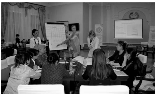
Darbnīca sadarbības tīklu veidošanai starp aktivistēm un politiķēm, pašvaldību un NVO pārstāvjiem NVO darba kapacitātes celšanai – sadarbības projektu ideju veidošana.