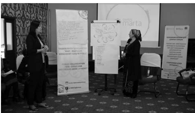
Apmācības dalībnieces prezentē savu skatījumu uz to, kāda ir veiksmīga sieviete politiķe, salīdzina šos priekšstatus ar priekšstatiem par veiksmīgu politiķi vīrieti.

Sievietes politikēs Kirgizstānā izveidoja individuālus kampaņu plānus, kā arī īstenoja dažādus interaktīvus uzdevumus, piemēram, devās ielās aptaujāt savus potenciālos vēlētājus par to, kādas tēmas, viņuprāt, kandidātēm vajadzētu izvirzīt par prioritātēm. Aktivitāšu dalībnieces izzināja finanšu piesaisti un pārvaldību, virzot interešu aizstāvību vai politisko karjeru. Tāpat tika izveidots neformāls sieviešu savstarpējās sadarbības tīkls, kurā iesaistījās pārstāves no NVO, valsts un pašvaldību sektora. Tas veicināja dzimumu līdztiesības jautājumu aktualizēšanu un sieviešu iespējām labvēlīgu politisko lēmumu pieņemšanu. Sadarbības tīkla veidošanas darbnīcu pārstāvji nāca klajā ar konkrētām iniciatīvām, ko plāno īstenot sieviešu interešu aizstāvībai un politisko procesu virzīšanai.