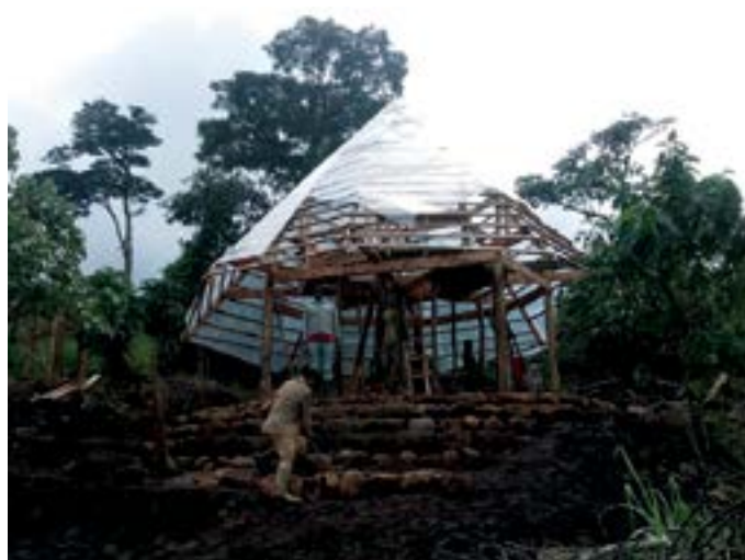
Top eko-māja, kur pārļaut nakti Misty Mountain School viesiem. Tiek izmantoti tikai vietējie materiāli. Tikai naglas nāk no Ķīnas.

Ierodoties Kamerūnā pēc gandrīz divu gadu darba pie EU Aid Volunteers (EUAV) iniciatīvas projekta, sanāksmēm Eiropas galvaspilsētās, globālo dienvienu analizēšanas uz papīra, pāris minūšu laikā sapratu, ka tagad ir tas mirklis, kad patiesībā tikai sākšu kaut ko iemācīties par ziemeļu - dienvienu attiecībām, varas struktūrām un citām lietām. Pāris mēnešu laikā man ir radusies diezgan skaidra izpratne par to, kā šeit tieku uztverts; par plašām, bet pilnīgi pamatotām atšķirībām mūsu