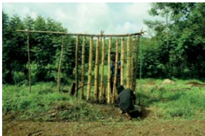
Kedjom - keku fermas izmēģinājumu daļā uzstādīts vertikālās dārzniecības paraugs, lai demonstrētu visiem un apkārtējiem lauksaimniekiem, kā iespējams iegūt ražu līdz pat piecām reizēm efektīvāk, neizmantojot ķīmiskos mēslojumus.

kultūrās un uztverēs; tāpat arī par pārsteidzoši daudzām līdzībām. Tas, ko cenšos pateikt ir, ka nekas neiemāca tik pilnvērtīgi kā klātienē pieredze. Uzskatu, ka klātienē gūtām zināšanām un pieredzei nereti ir lielāka ietekme kā tiešai attīstības palīdzībai. Tāpēc man ir liels prieks, ka līdzīgas mācīšanās