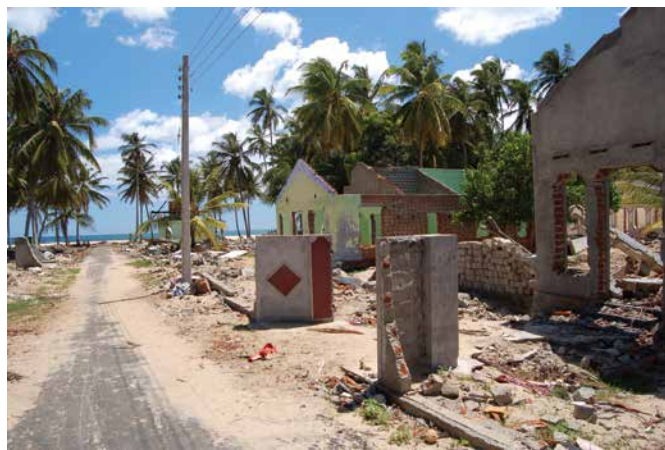
Cunami postījumi Šrilankas piekrastē (Thirukkovil, 2005. g.) Daudzviet Šrilankas austrumu piekraste izskatījās gluži kā cunami dienā. Līdzekļu trūkuma dēļ ēku gruveši nebija novākti. Cunami cietušajiem cilvēkiem tas atgādina traģēdiju un traucē atgriezties uz dzīvi piekrastē. Interesanti, ka attēlā redzamā vieta nebija mainījies arī 2015. gadā.

Jābūt gatavam tā sauktajam "kultūršokam", kurš agrāk vai vēlāk pienāk, kad ilgstoši jāuzturas citā kontinentā, citā kultūrā. Bija lietas, kas ļoti, ļoti atšķīrās no Eiropas kultūras. Piemēram, laika izjūta, punktualitāte. Bet, pro-