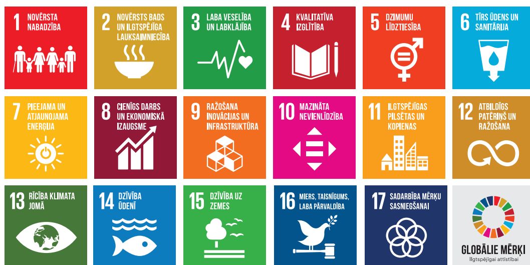
Attēls nr. 1: Ilgtspējīgas attīstības mērķi 2030. gadam

Ilgtspējīgas attīstības mērķu ieviešanas plānošanai būtiski ir apskatīt arī apakšmērķus , jo tie sniedz ieskatu katra mērķa padziļinātākā izpratnē un organizācijas sasaistes definēšanā.